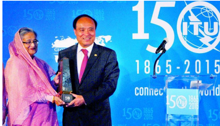
South-South Award 2011