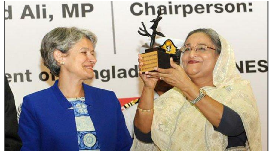
UNESCO Peace Tree Award 2014