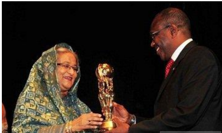
South-South Award 2011

মাননীয় প্রধানমন্ত্রী শেখ হাসিনা ২০০০ সালে সরকার প্রধান হিসেবে 'সহস্রাব্দ উন্নয়ন লক্ষ্য' ঘোষণায় স্বাক্ষরকারী এবং পুনরায় তিনিই সরকার প্রধান হিসেবে ২০১৫ সালে জাতিসংঘের সাধারণ সভায় 'টেকসই উন্নয়ন অভীষ্ট' ঘোষণাপত্রে স্বাক্ষর করেন।